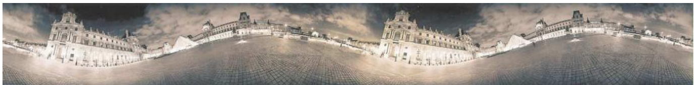
Die Stadt ist ein ewiges Auf und Ab, ein langer, bewegter Strom: Wir verlassen das Ufer und kehren doch immer zu ihm zurück wie hier am Hamburger Rathsplatz.